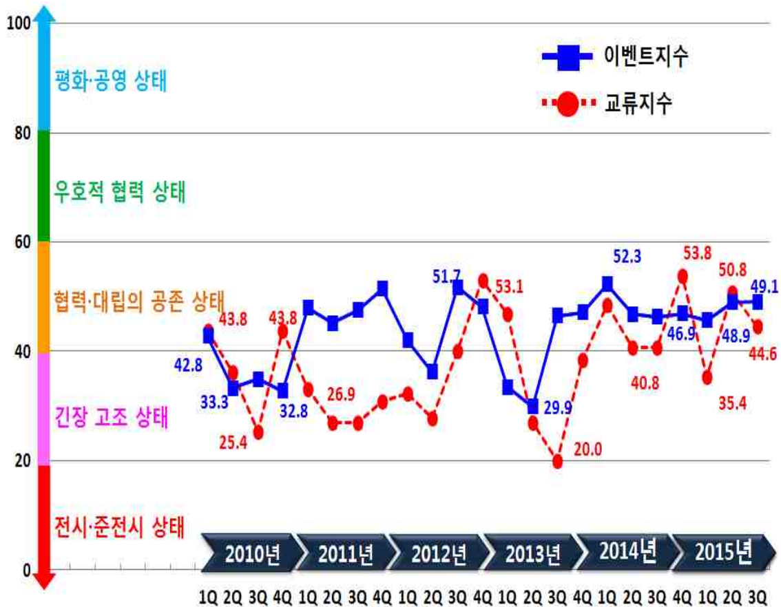
< 2010~2015 이벤트지수와 교류지수의 시계열 추이 >